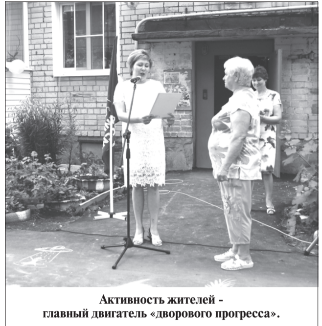
Активность жителей - главный двигатель «дворового прогресса».

Жители этих МКД приняли активное участие в благоустройстве своих дворовых территорий, вовремя организовали собрания и подали заявки для прове-