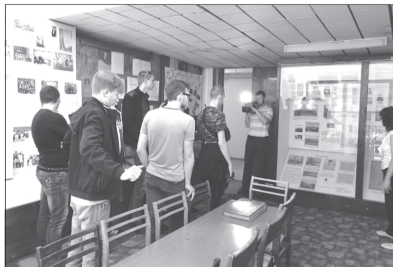
Знакомство с рабочими профессиями проходит успешно.

Работодатели представили студентам информацию о специфике работы предприятий, о выпускаемой продукции и услугах, о востребованности работников указанного профиля, о состоянии рынка труда в городе и районе, о государственных программах по поддержке молодых специалистов, о вакантных местах по профилю выбранной профессии. Такие мероприятия, безусловно, нужны выпускникам. Они помогают сориентироваться на рынке труда, получить реальную информацию об условиях работы на предприятиях, лично пообщаться с их представителями, успешно трудоустроиться. В ходе встречи выпускники также познакомились с запросами работодателей - всем им требуются профессионально-грамотные, трудолюбивые, ответственные, имеющие стремление к своему самообразованию и профессиональному росту молодые рабочие и специалисты.