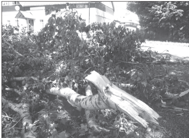
Такие завалы встречаются на каждом шагу - работы непочатый край.