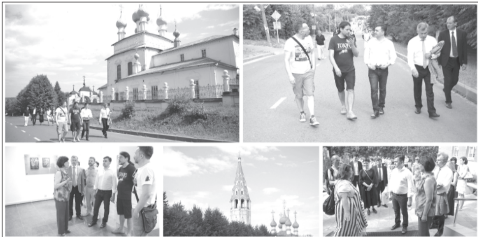
Столетие губернии даёт новый толчок для её развития.

Напомним, предложение Станислава Воскресенского о