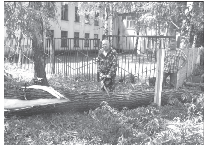
Поваленную иву рабочие школы №12 убирают своими силами.