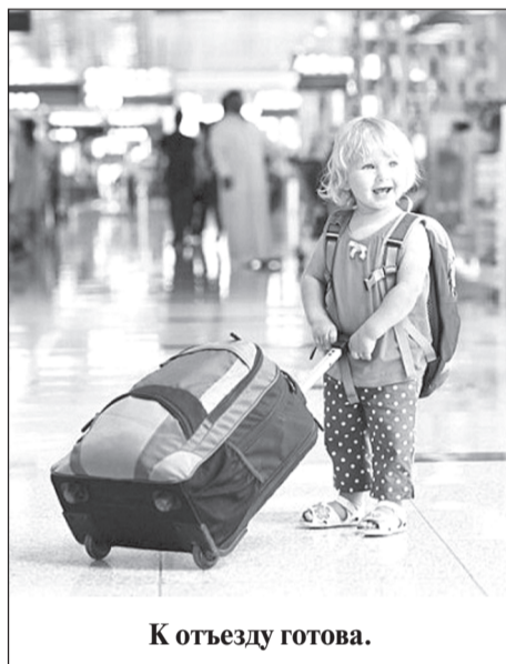
К отъезду готова.

Министерство юстиции России в письме от 19.12.2017 № 12-158024/17 высказало правовую позицию относительно нотариального удостоверения согласия на выезд ребенка за пределы Российской Федерации.