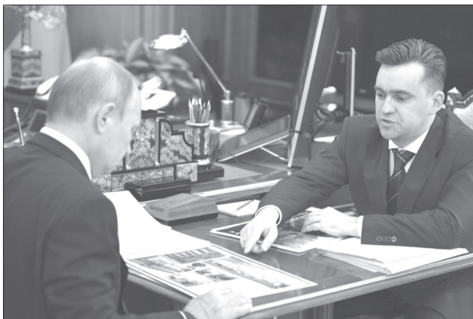
На встрече с Президентом страны Врио губернатора поднял ряд проблем.