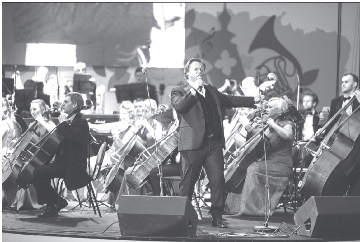
На сцене Торговой площади Плёса - народный артист России Василий Герелло.

Отметим, Дачный фестиваль имени Шаляпина проводится в Плесе с 2015 года. Фестиваль является ключевым событием «Года Италии в Плесе» - проекта, кото-