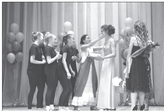
Возвращайтесь, мы ждём вас!