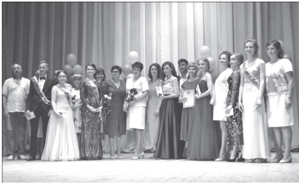
Кто счастлив больше - медалисты или их родители?

Выпускной бал-2018 открыл со сцены Городского дома культуры император Пётр I. Почти на стоящий и даже с усами. Повелел он трубить во все фанфары и имена отроков российских, умных, талантливых, во всеулышание объявить.