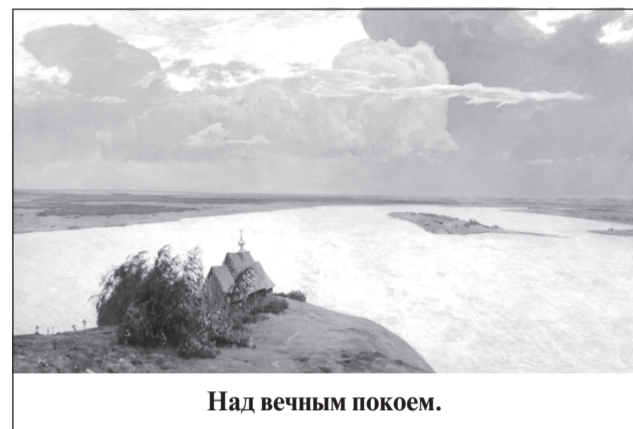
Над вечным покоем.

Это одна из известнейших работ гения русского пейзажа. Церковь на картине написана с этюда «Деревянная церковь в Плесе при последних лучах солнца». Сама картина, а также её эскиз под названием «Перед грозой», выполненный графитным карандашом на бумаге, хранятся в Государственной Третьяковской галерее.