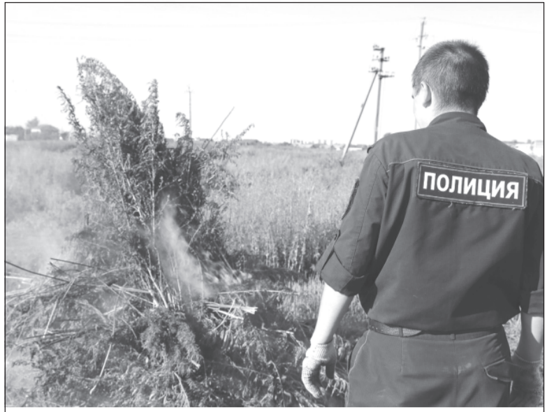
Эти растения никого больше не отравят.

- обратиться в правоохранительные органы, подробно сообщив о времени и месте совершения правонарушения или преступления, связанного с незаконным оборотом наркотиков, приметах лица, его совершившего.