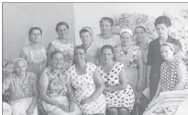
Дружный коллектив ткачей.

Несмотря на то, что День города остался позади, рубрика «Как молоды мы были» не закрыта. И те фотографии и связанные с ними воспоминания, которыми поделились с нами наши читатели, продолжают рассказывать о людях и событиях прошлых лет.