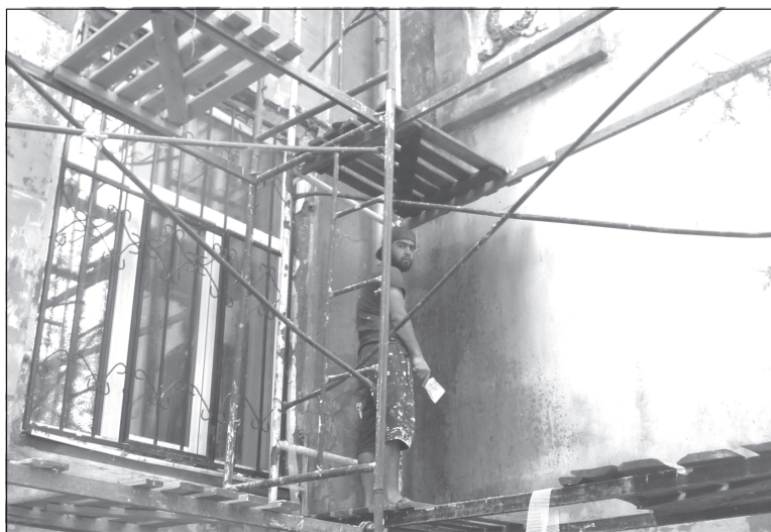
После ремонта фасад здания Приволжского ГДК заиграет новыми красками.

О ходе реализации приоритетного проекта «Формирование комфортной городской среды» доложил заместитель председателя правительства Ивановской области Максим Громов. На сегодняшний день в девяти муниципалитетах –