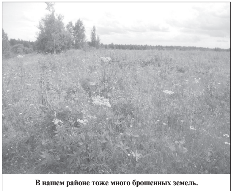
В нашем районе тоже много брошенных земель.

Установлены правообладатели таких земельных участков, в отношении которых инициированы внеплановые выездные проверки, согласованные с Костромской и Ивановской областной прокуратурой.