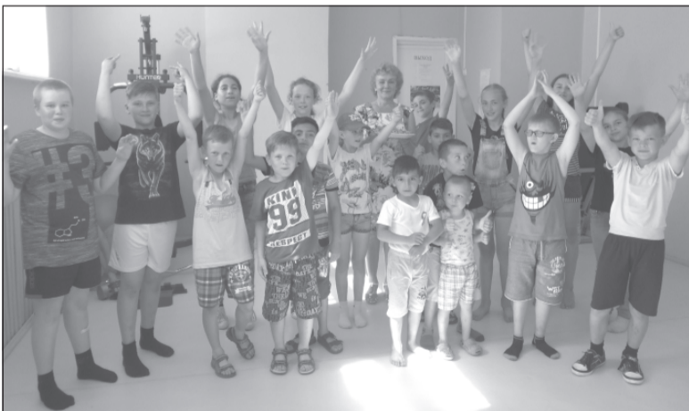
Маленькие жители с.Новое выбирают здоровье.

26 июня мировое сообщество отметило Международный день борьбы с наркоманией и незаконным оборотом наркотиков, который призван напомнить обществу о серьезной проблеме нашего времени — проблеме наркомании.