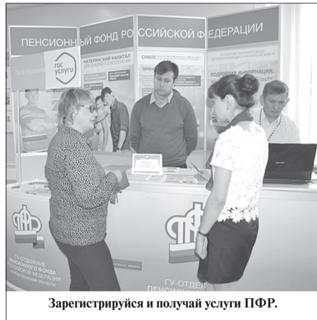
Зарегистрируйся и получай услуги ПФР.

Получение гражданами госуслуг ПФР через интернет, без личного обращения в территориальные органы, делает общение с Пенсионным фондом удобным и современным.