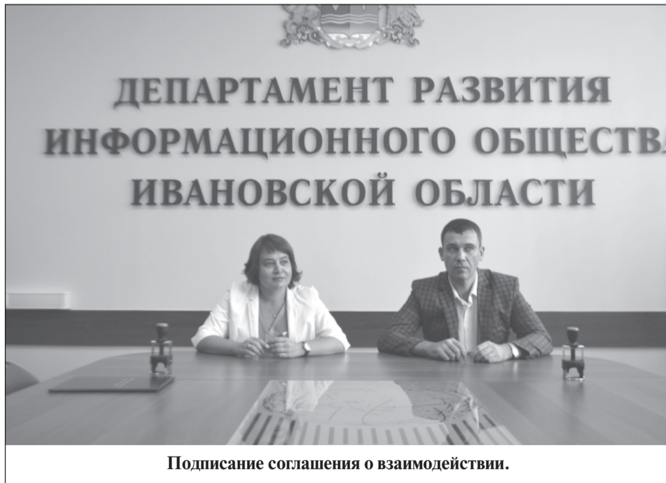
Подписание соглашения о взаимодействии.

Граждане РФ — жители Ивановской области, облада-