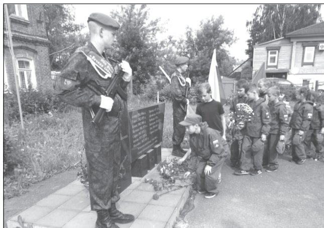
Помните о погибших!

Приволжские районные отделения «Боевого братства» и «Союза десантников» открыли мероприятия Дня памяти с митинга возле городского обелиска погибшим приволжанам в локальных войнах. Перед ветеранами боевых действий в Афга-